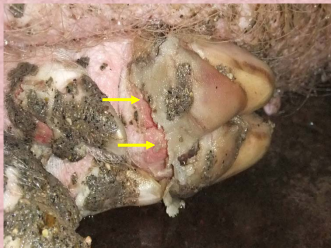
蹄部の水ぶくれの破れ