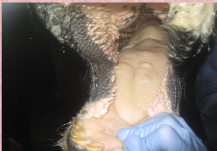
口内の水ぶくれ(初期の症状)